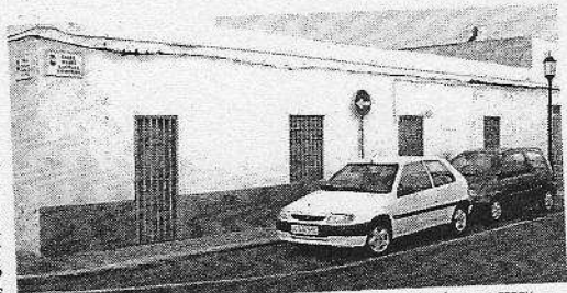
Fachada de la casa de Los cazadores, en el casco de Corralejo.