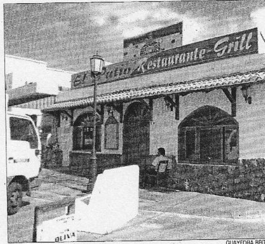
Vista del restaurante que explota Sincronía 99 y que ha levantado la polémica.