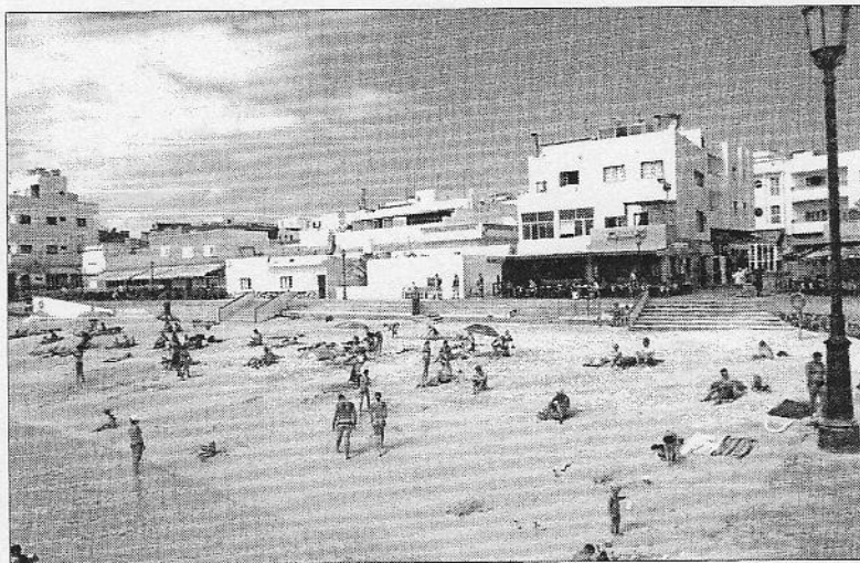
La Dirección General del Registro y del Notariado ha desestimado 22 escrituras de segregación en el casco de Corralejo.

Así continúa el conflicto abierto en la localidad turística tras la compraventa de terrenos en el casco antiguo por parte de la entidad mercantil Sincronía 99 SL, justo donde se levantan casas de los vecinos, heredadas en muchos casos de sus ante-