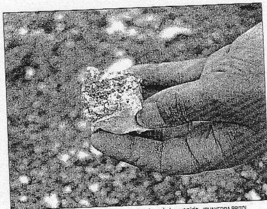
Un fragmento de Strombus encontrado en la obra de la avenida.