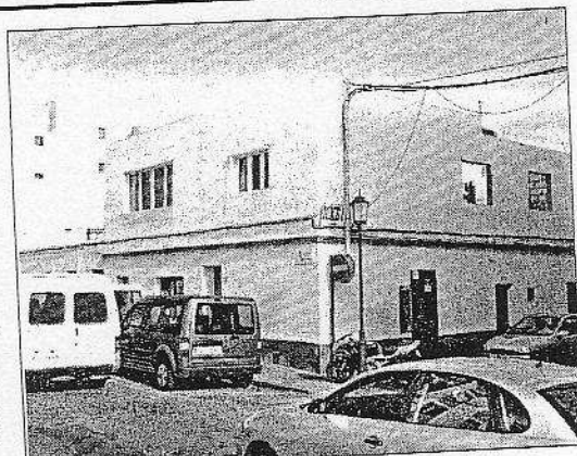
El solar de la calle Milagrosa número 15 de Corralejo. IGUAYEDRA BRITOX

En el caso del solar situado en la calle Milagrosa número 5 de Corralejo, que se pretendió registrar tras compra a Delval Internacional, el Registro de la Propiedad número 1 suspende la inscripción por «existir dudas fundadas» sobre la identidad del solar que parece estar inscrito en la finca 4.150. En cuanto a la segunda parcela que el registrador ha suspendido la inscripción, se trata del solar de 120 metros situado en la calle Lepanto número 14, esquina calle Almirante Carrero Blanco y José Segura -y que coincide con la terraza de una pizzería- que parece estar inscrita en la 4.160.