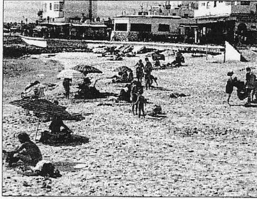
Playa del muelle viejo de Corralejo. (IGUAYEDRA BRITOI)

Por la vía de los juzgados también ha optado la mayoría de los vecinos mientras que