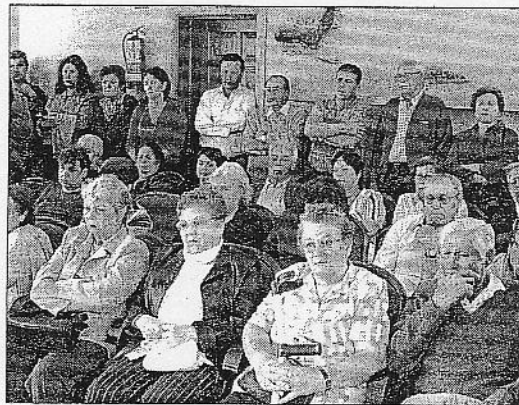
Reunión del grupo de gobierno con el casi centenar de afectados. IGUAYEDRA BRITOI

El objetivo de los vecinos, que han convocado una concentración para el próximo viernes en Puerto del Rosario, es pa-