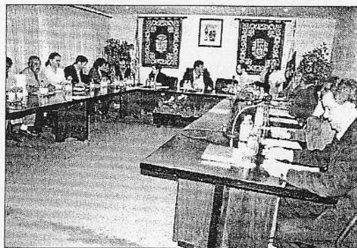
Imagen de archivo del último pleno municipal en Puerto del Rosario. (IGUAYEDRA BRITO)

Otra de las medidas planteadas por el grupo en la oposición es que se atienda la figura del voluntariado como elemento