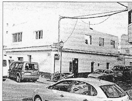
Una nueva sentencia viene a avalar las tesis de los vecinos de Corralejo. (IGUAYEDRA BRITO)

La sentencia, que condena en costas a la entidad demanda-