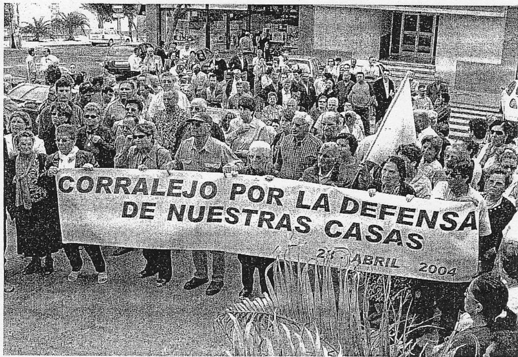
La última manifestación por las calles de la capital.

Sin embargo, la concentración más multitudinaria de esta asociación se celebró el 15 de agosto de 2003 y contó con la participación de miles de habitantes de la Isla. Un evento encabezado por los vecinos más mayores de Corralejo y del municipio de La Oliva.