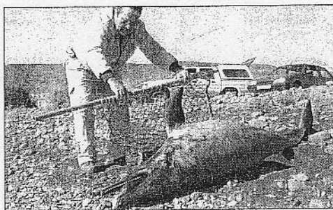
El cetáceo, de dos metros de longitud, llegó muerto a la orilla

Menos establecimientos de los previstos pusieron ayer el cartel de Rebajas en la Isla. Salvo contadas excepciones, como las colas a las puertas de Mango desde por la mañana, la afluencia de público a las tiendas fue aumentando por la tarde y se espera sea más numerosa durante el fin de semana en superficies como el centro Comercial Atlántico.