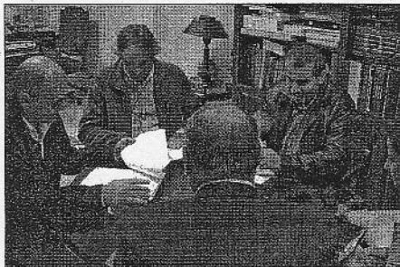
Los representantes del colectivo durante su vista con Cabrera.

A las críticas de los usuarios y de los profesionales contra los servicios de la Tesorería se suma Coalición Canaria, que manifiesta su rechazo al trato que reciben trabajadores y empresarios debido a la falta de medios y personal necesario.