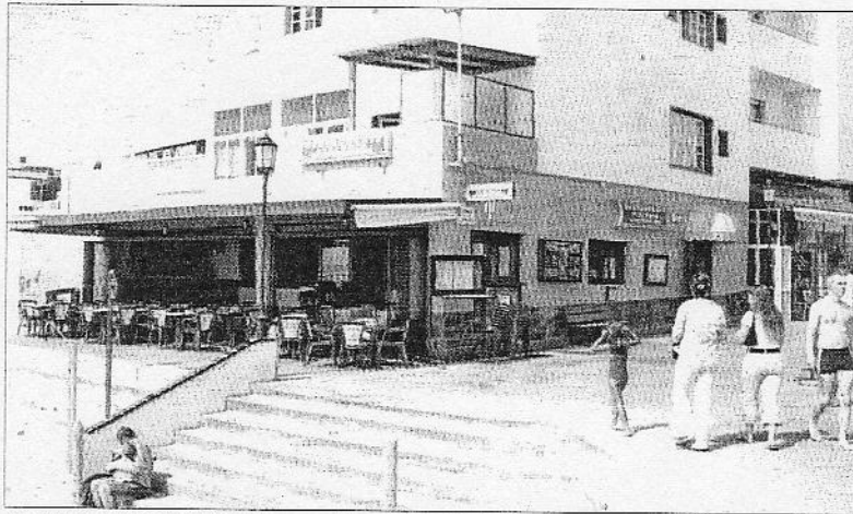
Sin registro. Muchos vecinos del casco antiguo de Corralejo han perdido la propiedad sobre sus casas.

El Cabildo se muestra preocupado por este problema, que también se ha producido en otras localidades de la Isla. Por ello ha promovido unas jornadas informativas, y sus representantes acudirán este sábado a la manifestación convocada en Corralejo para protestar por esta situación. Porque, como explica su presidente, Mario Cabrera, «estamos convencidos del derecho de nuestros vecinos y del valor de la palabra de nuestros mayores».