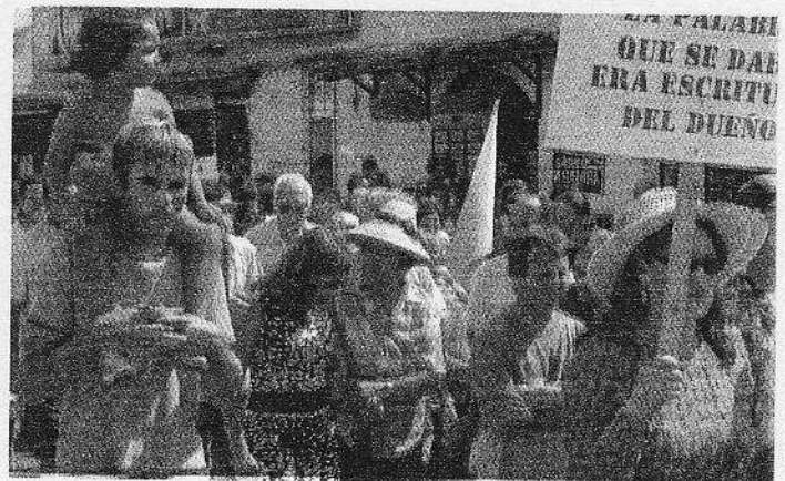
Diversas imágenes tomadas de la concentración de Corralejo. Un pueblo en pie de Guerra por sus derechos. Crónica