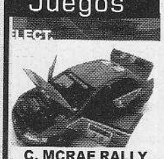
C. MCRAE RALLY