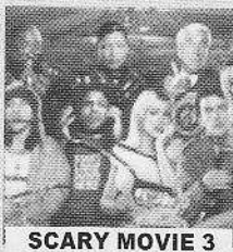
SCARY MOVIE 3