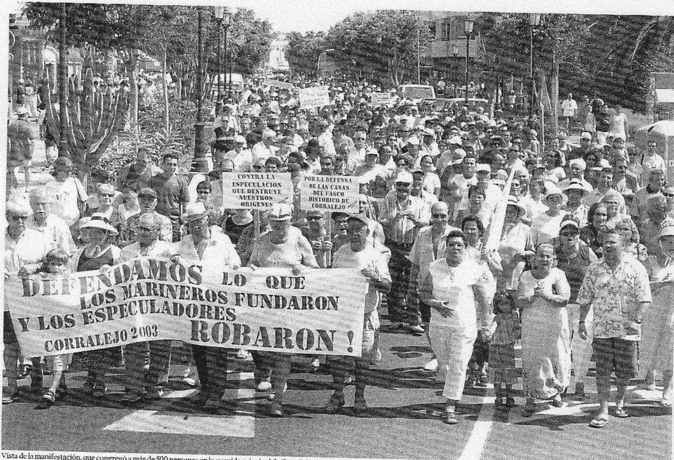
Vista de la manifestación, que congregó a más de 500 personas en la avenida principal de Corralejo.

MARCHA MULTITUDINARIA EN CORRALEJO | INDIGNACIÓN CIUDADANA