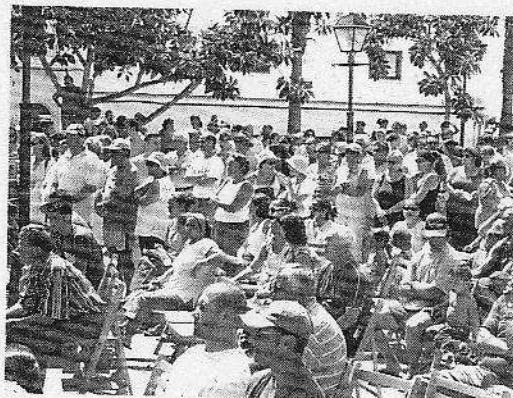
"Son nuestras raíces". Los vecinos gritaron ayer que las casas que se encuentran en el casco histórico de Corralejo son algo más que viviendas. "son nuestras raíces". Recordaron el duro trabajo de los pescadores y sus familias para levantar unos inmuebles que hoy se encuentran en el ojo del huracán.