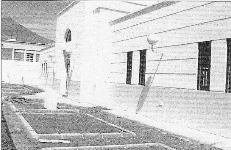
El inmueble que estaba destinado para una guardería se encuentra abandonado desde hace varios años.

El inmueble ubicado en El Palmeral lleva varios años abandonado, sin que el Ejecutivo regional culminara su intención inicial de destinarlo como guardería. Durante todo este tiempo ha pasado por numerosas vicisitudes administrativas, que han imposibilitado su uso social.