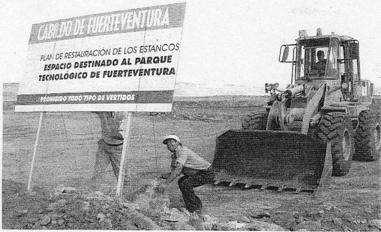
Un tractor en la escombrera de Los Estancos.

Baile de fincas. Los vecinos del casco viejo de Corralejo presentaron ayer un gran mapa de la localidad norteña (en la imagen) para ilustrar el baile de fincas, ya que "muchos terrenos registrados en la finca 951 pertenecen físicamente a la 2.527, y ascienden a 62 viviendas".