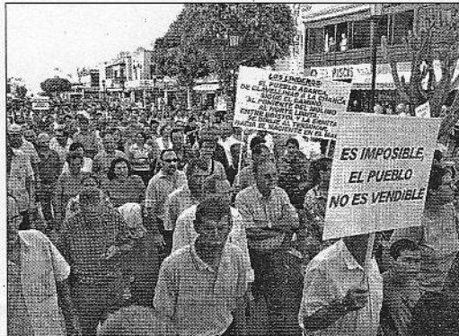
Corralejo se echó a la calle para respaldar a los dueños de las casas.