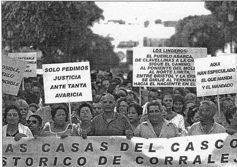
Cabecera de la manifestación que se celebró en Corralejo.