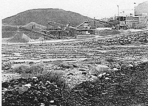
Panorámica de la cantera de La Caldereta.