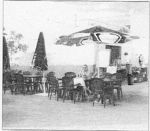
El comité denuncia la venta del Antiguo Café del Puerto como si fuera un solar.