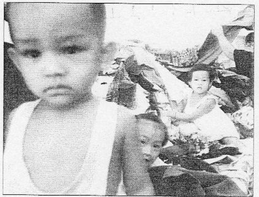
Niños víctimas del maremoto en Tailandia. IFAJ

Las reuniones están siendo convocadas durante estos días desde las consejerías de Seguridad y Emergencias y de Asun-