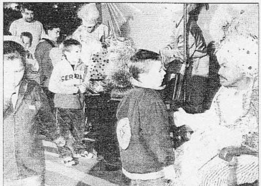
Con más de una hora de retraso salió la cabalgata en Gran Tarajal. (I. BRITO)