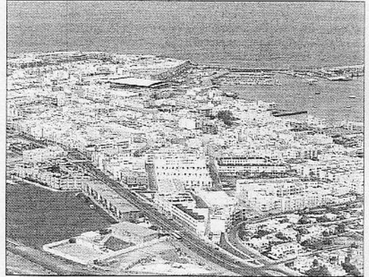
Vista aérea del casco antiguo de Corralejo y de las viviendas afectadas.