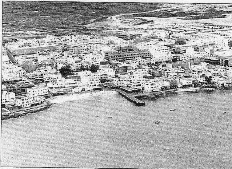
Imagen actual de viviendas en primera línea de playa.

El comité explica que tras el nacimiento de Corralejo, pueblo humilde de pescadores, hoy