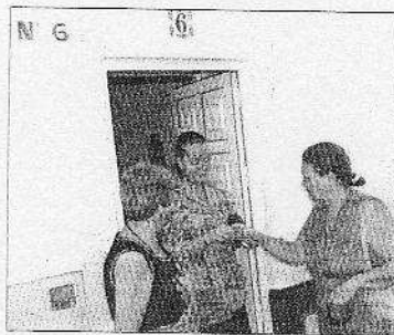
Temerosos. Afectados a la puerta de su vivienda

En el número 6 de la calle de La Iglesia, en Corralejo, el pago de la contribución municipal es siempre una mezcla de temor y alivio. Miedo a que cuando lleguen a la oficina les digan que ya está pagado, que otra persona se ha quedado legalmente con su casa. Alivio porque el recibo es una prueba más de sus derechos para presentar ante el juez.