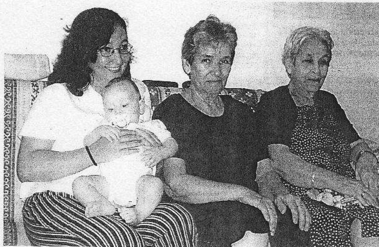
Cuatro generaciones de la familia Morera de Corralejo.