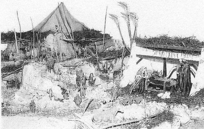
Inaugurado el belén del Ecomuseo de Teñía. El Cabildo inauguró ayer el belén del Ecomuseo de La Alcojida, de Teñía, que se ha instalado en la recepción de este espacio. Los niños podrán entrar gratuitamente al museo durante estas fiestas para contemplar la decoración navideña. Asimismo, el próximo 13 de diciembre se celebrará un acto con los escolares y se mostrará la actividad en el nuevo horno de cal que se ha restaurado.