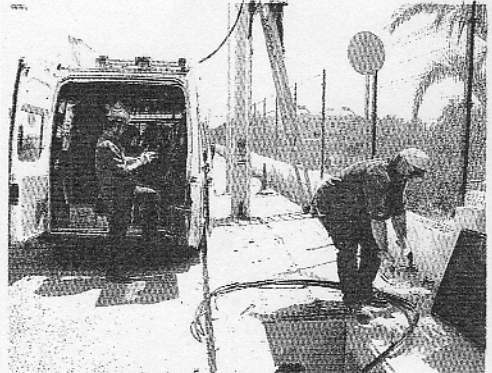
Operarios colocando farolas en el barrio de Fabelo.

Con este acuerdo se podría ofrecer un servicio tan básico como el alumbrado, que algunos barrios todavía no poseen con el correspondiente peligro para los viandantes y la inseguridad que genera entre los residentes.