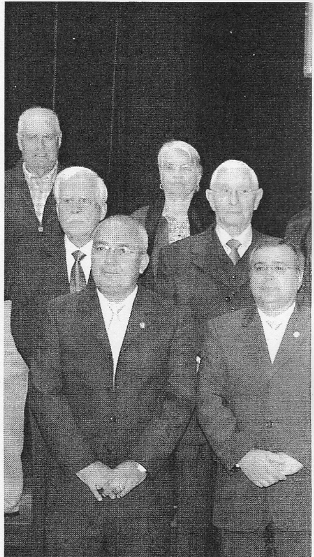
Los galardonados posan al final del acto con el presidente y portavoces de los distintos grupos

Los galardonados intervinieron, algunos muy emocionados, para agradecer la distinción.