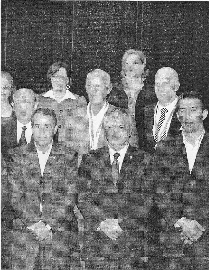
del Cabildo de Fuerteventura.

■ Encuentro de fútbol entre el Gran Tarajal y La Atalaya, de categoría Preferente (17.00) ■ El CCN-IF presenta sus candidaturas en el Auditorio de Gran Tarajal (21.00)