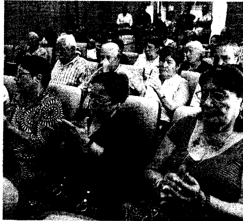
Un grupo de vecinos afectados por la propiedad de sus viviendas.

El representante vecinal recordó "a los vecinos más veteranos, que se nos han quedado por el camino, y que también contribuyeron a esta lucha en la que desde el principio se coordinaron también todas las fuerzas políticas para prestar su apoyo a estos vecinos, así como las instituciones del Cabildo insular y el Ayuntamiento de La Oliva".