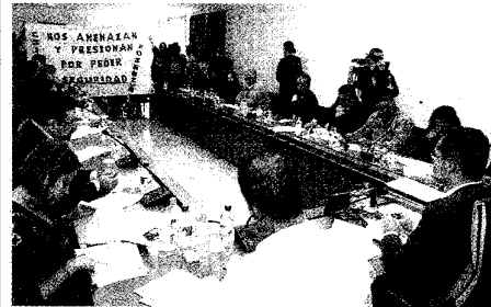
El alcalde, Marcial Morales, observa al fondo a los bomberos.

Los bomberos majoreros estudian presentarse en todos los actos públicos donde asista el alcalde, Marcial Morales, para protestar contra la política que lleva el Ayuntamiento portuense en materia de seguridad, especialmente, en el servicio contraincendios.