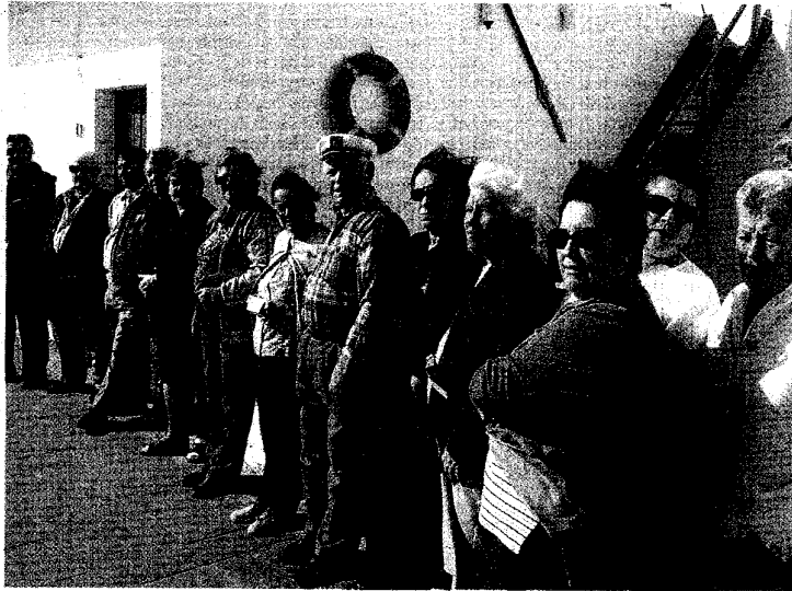
Un grupo de vecinos de Corralejo, que lucha por la propiedad de sus viviendas.

El próximo viernes se desplazarán a Gran Canaria unos 70 vecinos afectados para hacer entrega al fiscal Anticorrupción de los resultados de una investigación sobre la trama diseñada para arrebatarse de sus casas. El informe está compuesto por más de 500 folios donde se pone al descubierto la identidad de un entramado de empresas, algunas con sede en Sudamérica, así como la recopilación de numerosa documentación que prueba la