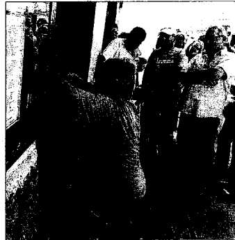
El Patio. Desahucio, ayer, del restaurante.

El Comité de Afectados del Casco Viejo de Corralejo destaca esta sentencia «como una de las más importantes desde el comienzo del conflicto por la venta ilegal de parcelas, en tanto en cuanto éste es el único inmueble que, por los motivos descritos, no está en manos de los vecinos».