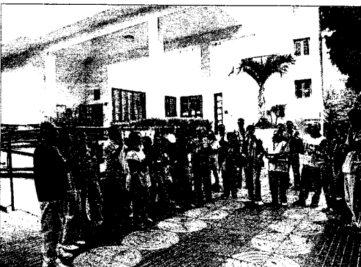
Protesta. Imagen de archivo de una protesta de los trabajadores de Clusa.

Garantizar la nómina de los trabajadores municipales, reforzar las ayudas sociales a la vista del incremento de la petición de ayudas e intentar que la deuda a terceros se liquide a la mayor premura posible son tres de los objetivos del presupuesto para el próximo año. Entre las inversiones, previstas para el 2009 pero que se reincorporarán para el 2010 por financiarse con un préstamo a diez años de 1.300.000 euros, destacar el centro de mayores de Gran Tarajal cuya inversión asciende a 316.000 euros, y la ejecución de dos campos de césped artificial en Tuineje casco y Las Playitas.