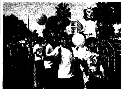
Día del niño. El Cabildo majorero organizó ayer un pasacalle con la participación de 200 escolares, así como la lectura de un manifiesto de los niños en conmemoración del 20º aniversario de la Convención de los Derechos de los Niños y Niñas. El desfile también contó con papahuevos, serpientes humanas, batucadas y una carrera de globos.