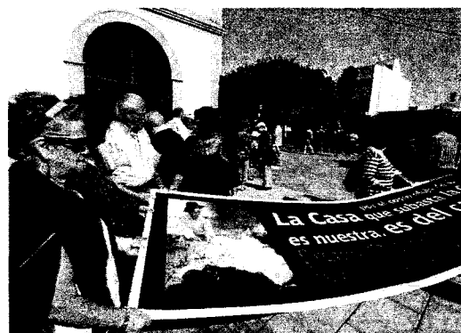
Los vecinos de Corralejo, ayer, en la capital, portando la pancarta.

Los afectados se concentraron ayer en la plaza de la Iglesia de la capital portando una pancarta con sus reivindicaciones y anunciando que una entidad bancaria ha solicitado la ejecución de la misma por el incum-