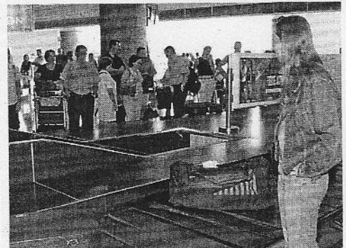
Pasajeros en el aeropuerto de Fuerteventura.

Asimismo, se contabilizaron 234 toneladas de carga y tres toneladas de correo.