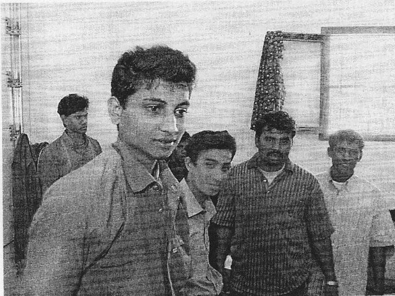
Inmigrantes de Bangladesh en el cuartel de Gran Tarajal.