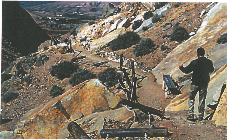
Imagen de los pilares de seguridad del sendero a la ermita de Malpaso, tras ser arrancados.

La consejera de Medio Ambiente del Cabildo, Natalia Évora, anunció que colaborará en el arreglo de los daños, y aseguró que el Ayuntamiento de Betan-