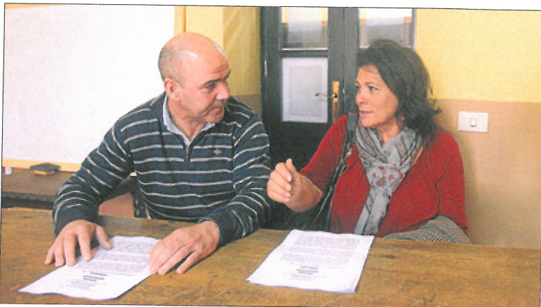
En rueda de prensa. Representantes del comité de afectados, ayer en Puerto del Rosario.