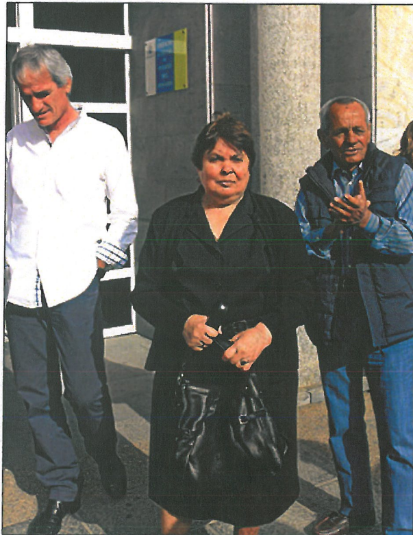
Declaraciones. Concentración de los vecinos de Corralejo Viejo ayer en los Juzgados.