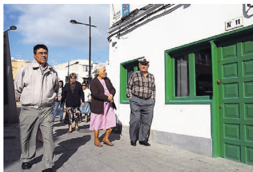
Vecinos de Corralejo ante una de las casas afectadas por la trama.