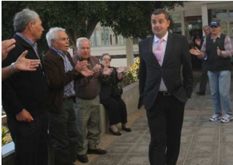
LA SOSPECHOSA IMPLICACIÓN DE UN ABOGADO, EN EL CASO DEL CASCO VIEJO DE CORRALEJO