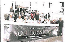
Vecinos de Corralejo.

El Tribunal Supremo ha fallado por decimotercera vez a favor de los vecinos del casco viejo de Corralejo, que desde hace años vienen reclamando en los tribunales la propiedad de sus casas que pretenden arrebatárselas una trama inmobiliaria.