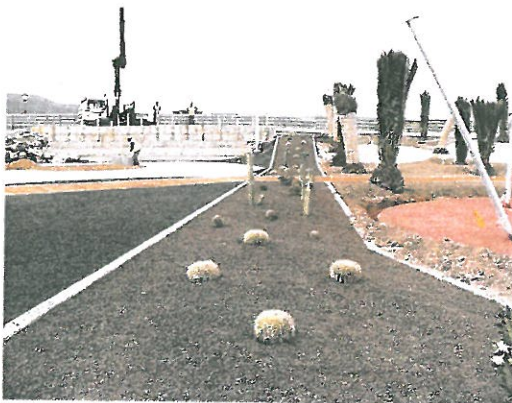
Imagen del estado actual del futuro parque botánico de Corralejo.

La inversión de este ambicioso proyecto es de 1.000.000 de euros procedentes de los fondos