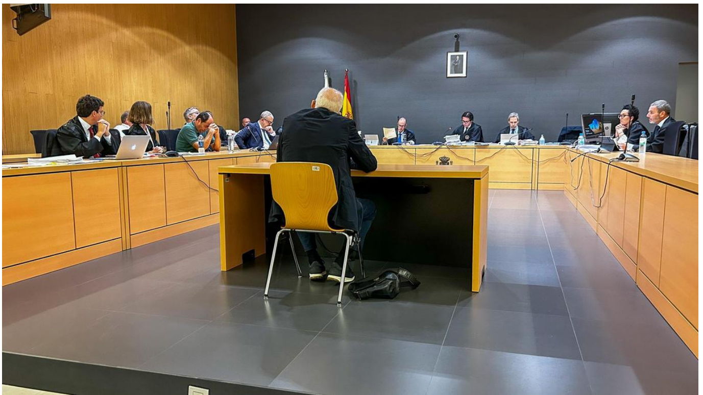
Uno de los afectados por el caso del Casco Viejo de Corralejo declara ante los acusados, a la izquierda.

Las Palmas de Gran Canaria | 17·10·23 | 18:08 | Actualizado a las 18:28